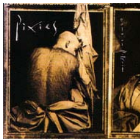
Come on Pilgrim

Absolutamente toda su discografía es digna de formar parte de la colección de rock. He aquí la lista de los álbumes que se publicaron bajo el sello de la no menos legendaria compañía 4AD.