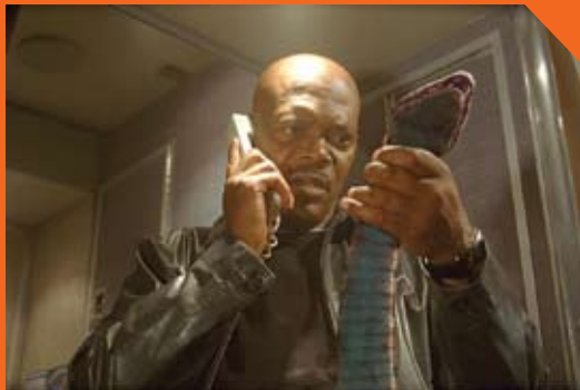
Snakes on a Plane